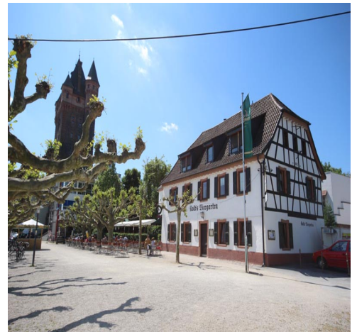
Kolbs Wirtshaus /Rheinpromenade 1

WICHTIG: Die männlichen Teilnehmer müssen auf dem jüdischen Friedhof eine Kopfbedeckung tragen (Hut, Mütze etc.).