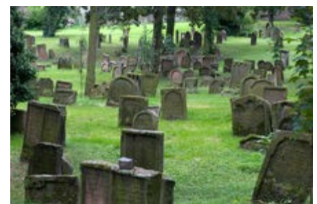
Jüdischer Friedhof 1