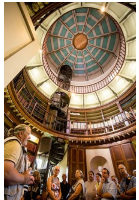
Schloss Herrnsheim 1