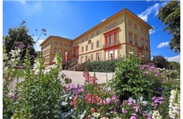
Schloss Herrnsheim 2