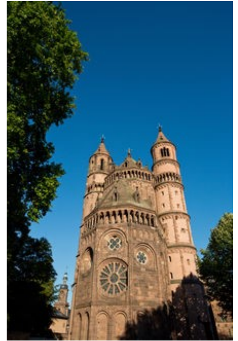
Wormser Dom 1